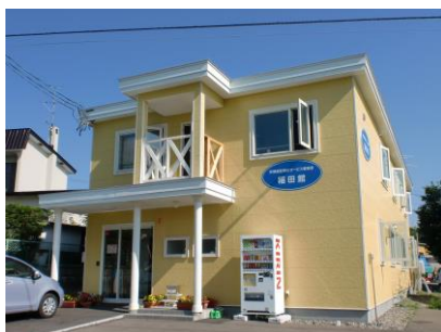
北斗リハビリセンター